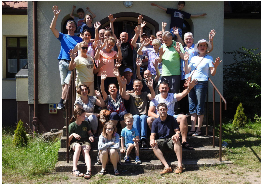
Vi forkynder Guds sande nåde igennem Kristi kors

Vi er utroligt glade for, at budskabet om korset og Guds forvandlende nåde har fået en så flot modtagelse i Polen, hvor vi blandt andet deltog på en lejr i en uge og fik lov til at forkynde indgående om resultatet af det, Jesus gjorde på korset og vores stilling i ham. Vi talte blandt andet ud fra Romerbrevet kapitel 5 til 8. Romerbrevet beskriver selve kernen i evangeliet og den nye pagts betydning for os. Vi bringer herunder en lille smagsprøve på undervisningen denne bibel-camp i Zelazno. På billedet til højre ses nogle af stævne-deltagerne. Flere var allerede rejst hjem. Udover lejren besøgte vi for første gang pinsemenigheden i Olesnica, hvor mange fortalte om, at budskabet havde berørt dem dybt, og at Gud havde talt direkte til deres hjerter ved Helligåndens virke.